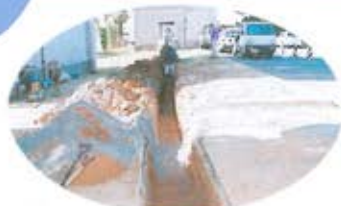
工学部職員宿舎での立会調査