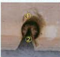
①棒を当てる部分と、②摩擦で生じた木粉を差し込み式にしました。ためる部分を作ります。