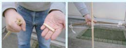
まっすぐな木がなかったので、弓状の木にひもを結び、火キリ棒に絡ませます。ひもをピンと張ります。