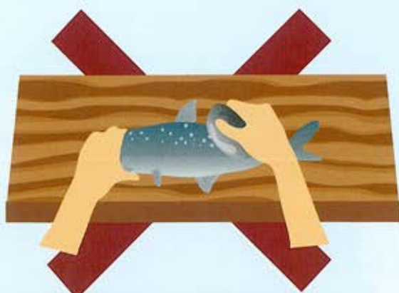
魚や野菜を切る道具ではなく…