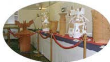
第21回企画展オープン