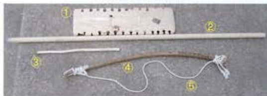
①火キリ用の板 ②③火キリ用の棒 ④弓状の木 ⑤ひも