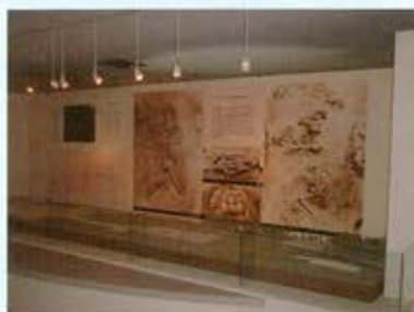
土井ヶ浜遺跡・人類学ミュージアム展示室