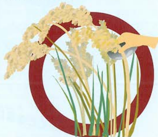
稲穂を刈り取る道具なのです！