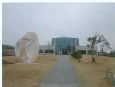
土井ヶ浜遺跡・人類学ミュージアム外観