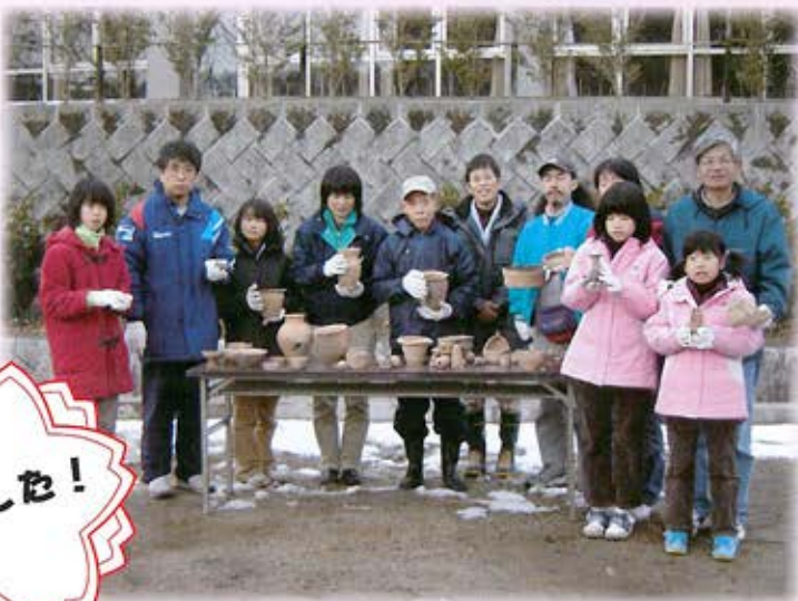
受講者の皆さんとできあがった土器