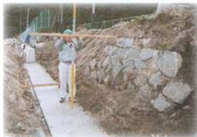
光構内での立会調査