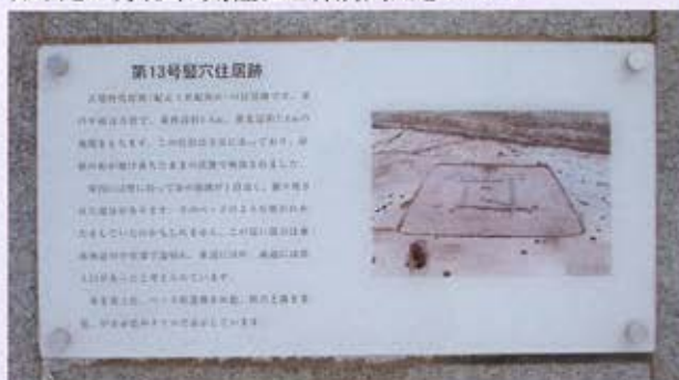
竪穴住居跡に設置された説明版 (第13号竪穴住居跡)