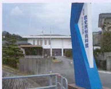
山口市歴史民俗資料館外観