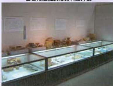
山口市歴史民俗資料館展示室