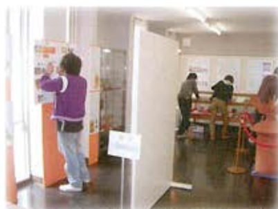
テスト前に企画展を熱心に観覧する山口大学生

3月 3/1(水)～3/31(金) 展示替えのため休館。 3/24(金) 第1回学術情報機構埋蔵文化財特別展 『あしもの遺跡シリーズ1 古代の吉田遺跡』(於：山口大学総合図書館)終了。 来年度も新たな展示を行う予定です。総合図書館に入館される方は是非ご覧ください。