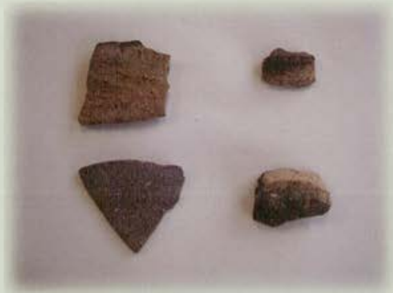
縄文時代河川出土土器