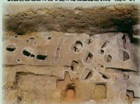
確認された柱穴跡群（北から）