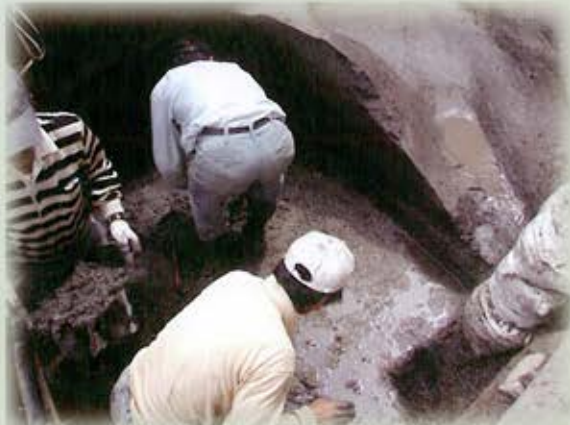
縄文時代河川掘削状況