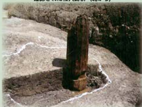
出土した柱（北西から）