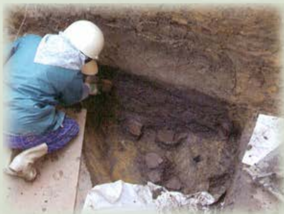
G調査区遺物出土状況