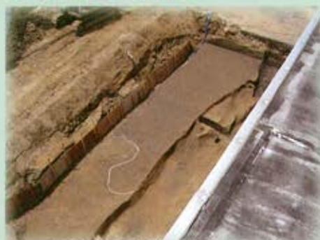
検出された巨大な落ち込み（北東から）

調査で確認された土層から推測すると、2棟の建物は土石流のような自然災害によって廃絶したものと思われる。その後、水分の多く含まれる土中に埋没していたことが幸いし、柱材自体が残ったのでしょう。古代の建物跡の確認と柱材自体の出土という大きな成果を得た調査となりました。（横山成己）