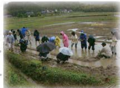
公開授業での田植えの様子

公開授業『古代人の知恵に挑戦！ー古代のお米をつくってみようー』第 2 回授業開催。