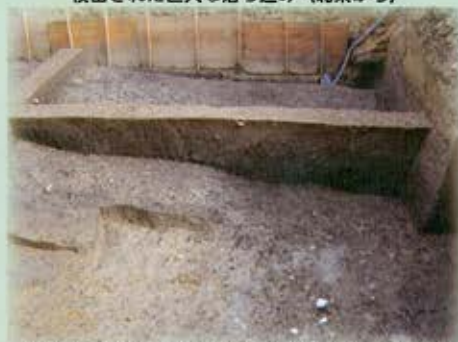
調査区西端部の落ち込み堆積土掘削状況（北から）