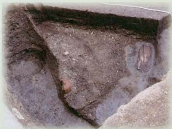
D調査区遺物出土状況