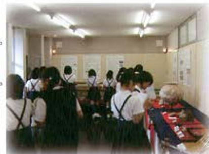
平川小学校 6 年生の集団見学