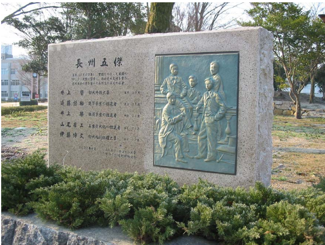
長州五傑（初代外務大臣 井上馨、造幣事業の推進者 遠藤謹助、鉄道事業の推進者 井上勝、工業近代化の推進者 山尾庸三、初代総理大臣 伊藤博文）の顕彰碑（吉田キャンパス）

また、新館の地下1階は 集密書庫 となっており、電動書架が設置してあります。通常通り貸出のできる図書や一部の雑誌が配置されています。なお、地下1階の書庫は自由に入ることができます。