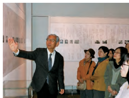
文学散歩(中原中也記念館にて、平成30年)

私自身は中原中也記念館の館長(2008(平成20)年まで副館長)として同会に関わってきたが、昨年度からは会長に就任し、山口県立大学の加藤禎行准教授、山口県立山口図書館の井関和彦主査とともにワーキンググループの一員として『燭台』の調査にあたった。年度末にはささやかな報告会を開く予定であったが、新型コロナウイルス感染拡大の影響を受けて中止を余儀なくされた。