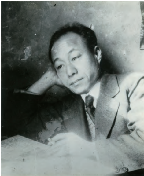
吉田常夏肖像写真

雑誌『燭台』の発行者であった吉田常夏(1889〈明治22〉年～1938〈昭和13〉年)は、大正・昭和初期の詩人・編集者である。小説集『三都情話』(1918〈大正7〉年5月、三陽堂書店)、青柳有美と河井醉茗の他序をそなえた恋愛警句集『朱唇秘抄』(1918〈大正7〉年10月、三陽堂書店)などの著作を残してはいるが、日本近代文学館編『日本近代文学大事典』(講談社)に吉田常夏の立項は見られない。