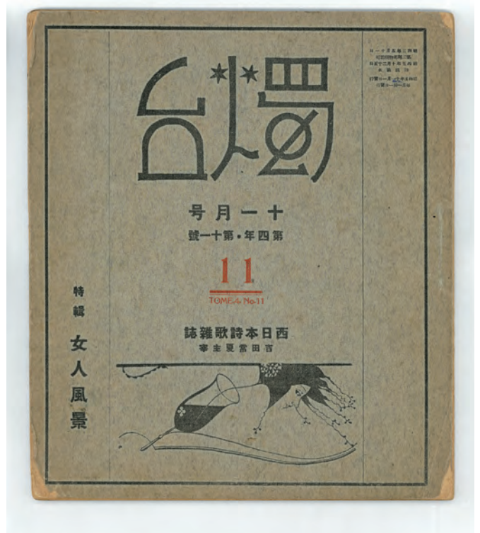
昭和5年11月号 表紙山名文夫