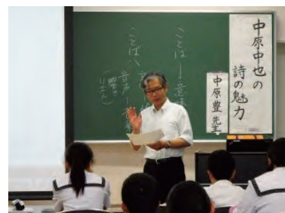
おでかけ講座(高森高等学校にて、平成27年)