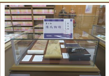
図書館所蔵の資料と平安時代をイメージした雛人形を展示。