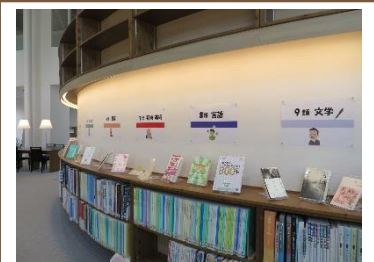
配架場所の案内と請求記号ごとに貸出の多い図書を展示。