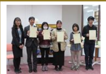
YPU Library フォトコンテスト入賞者の皆さん。