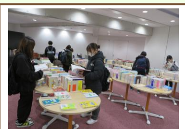
ブックリユース市で再利用される除籍された図書や雑誌。