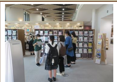
図書館学生協働 YPU LEC メンバーが案内係を務めました。