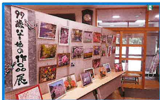
明木／「99歳父と娘の作品展」