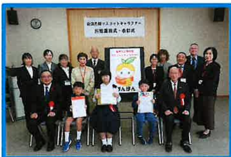
萩／「マスコットキャラクターお披露目式・表彰式」