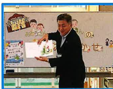
須佐／「おとうさんとおじいちゃんの読み聞かせ」