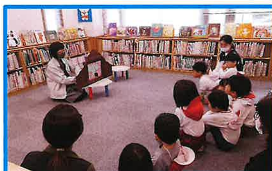
明木／「ちっちゃなおはなし会」