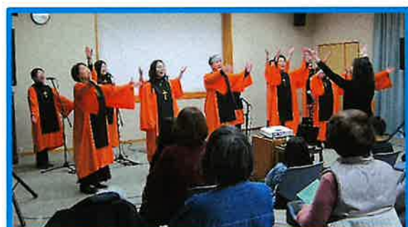
萩／「クリスマス☆ゴスペルコンサート」